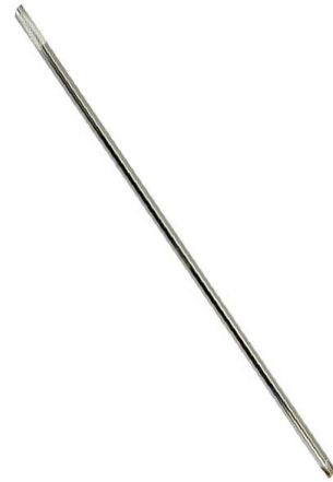
Locking Pin Szpilka - pręt