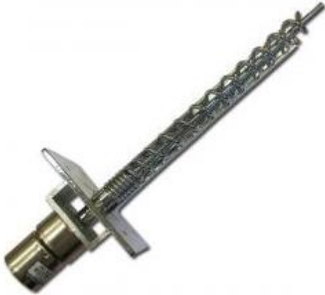
Prize Arm with locking pin inside Ramię ze szpilką