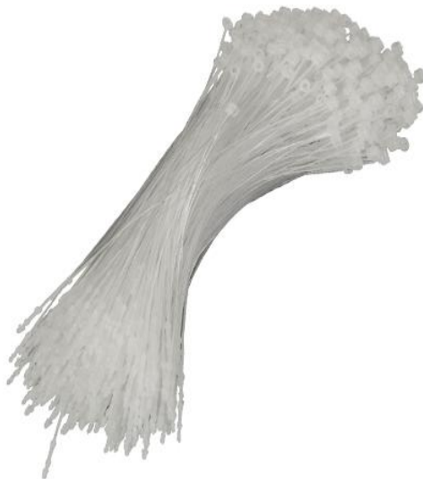
Hanging Ties Plastikowa zawieszka – opaska kablowa